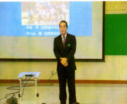
写真4 志良堂教育長