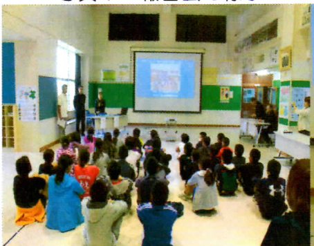
写真3 聞き入る5・6年生