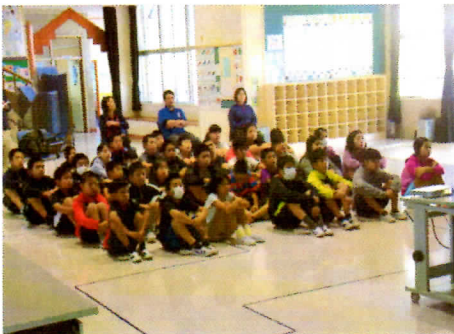
写真1 報告会の様子

5・6年生の皆さんが、中学生になった時、チャンスを活かしてチャレンジしてほしいと思います。