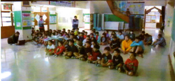
写真2・3 読み聞かせ