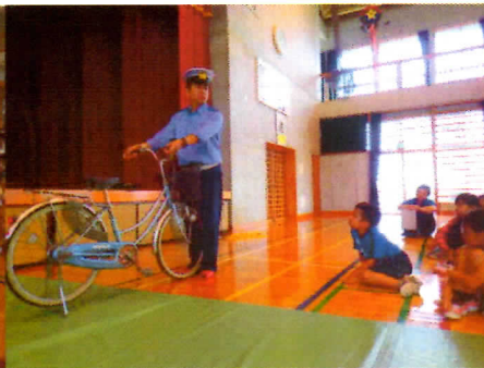
写真4 自転車の点検の仕方