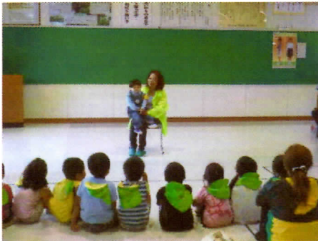
写真1 腹話術による講話

多くの児童が自転車を所有しています。一人一人が交通ルールとマナーを守り、正しく安全に自転車を乗ることが出来るようにしていきたいと思えます。保護者の皆様もご協力、よろしくお願い致します。