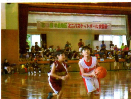
写真6 女子A決勝戦の様子

去る5月13日(土)・14日(日)に今帰仁小学校で開催された、第28回半島地区ミニバスケットボール交歓会で、女子Aが準優勝、Cチーム(3年生以下)がBブロックで優勝しました。低学年の子ども達の中には、初めて大会に出場した子どももおり、優勝できたことに大喜びの様子でした。