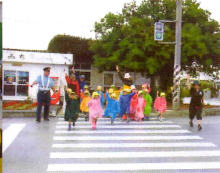
写真2 横断歩道の渡り方