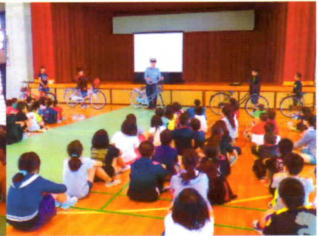
写真5 交通安全指導の様子②