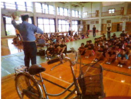
写真3 交通安全指導の様子①