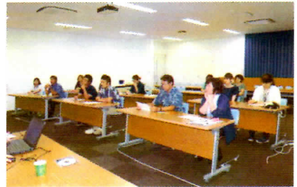
写真1 「宜野座村ITパーク視察」

子ども達も夏休みの課題にしっかりと取り組んでくれると、二学期は、実り多きものとなると思います。保護者の皆様、ぜひ、子ども達への声かけをよろしくお願いいたします。