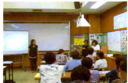
写真3 村内研修「プログラミング学習」