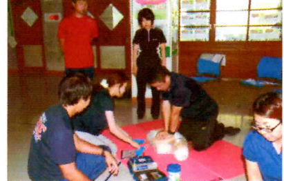
写真2 校内研修「救急救命研修」