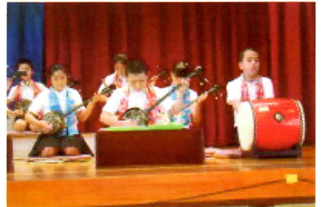
写真2 5年生の三線演奏