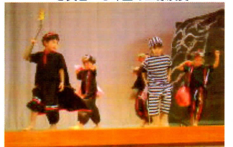
写真3 アリババと40人の盗賊に一場面