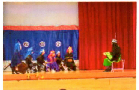
写真1 本部大主の一場面