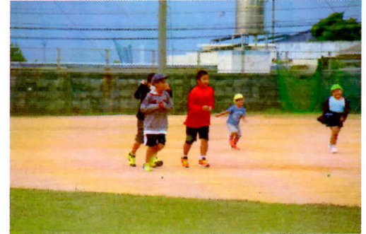
写真1 スロージョギングの様子

12月12日に行われる校内持久走大会に向けて、もうひと頑張りです。ご家庭でも12月も～早寝・早起き・朝ごはん・朝うんち～の規則正しい生活習慣を忘れずに日々を過ごしてください。