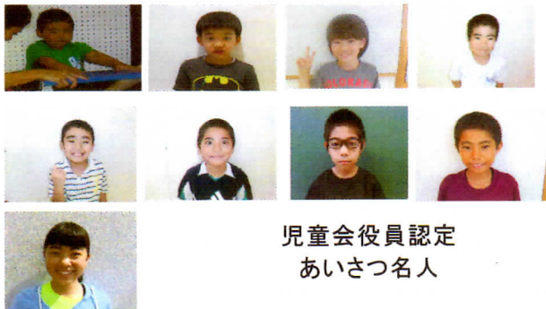
児童会役員認定 あいさつ名人