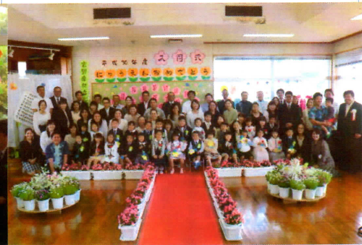
写真4 入園式の集合写真