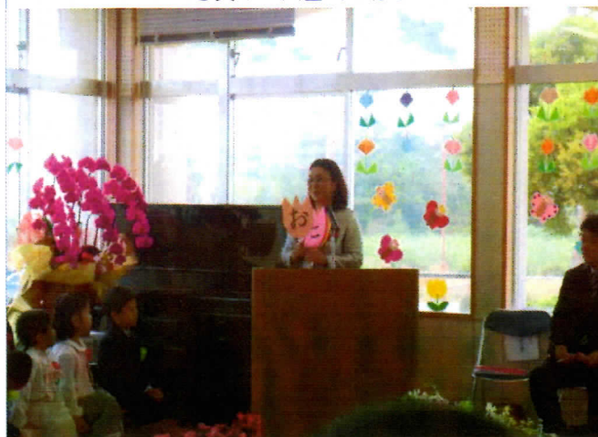
写真3 お祝いのご挨拶