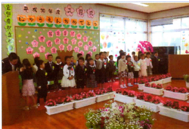
写真1 入園式の様子