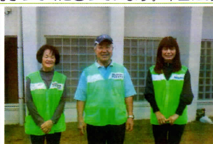
写真1 民生委員・児童委員の皆さん