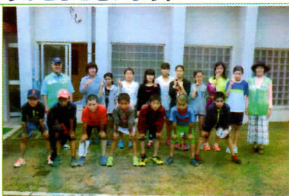
写真2 6年生のあいさつ運動