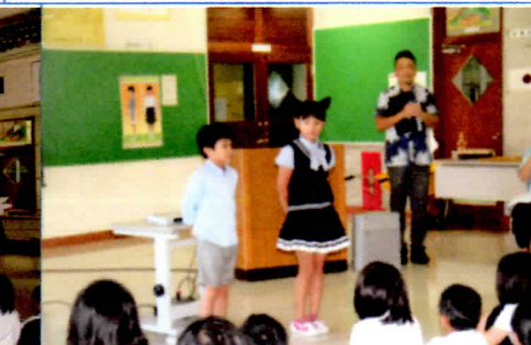
写真5 転入児童の紹介