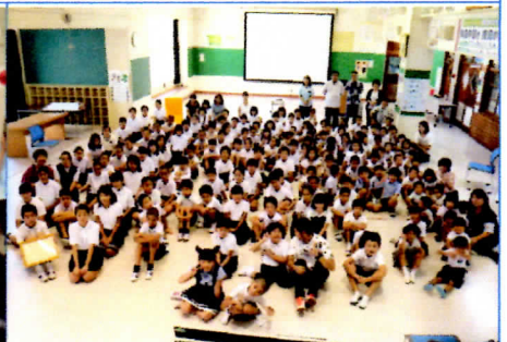
写真6 全校児童・幼児