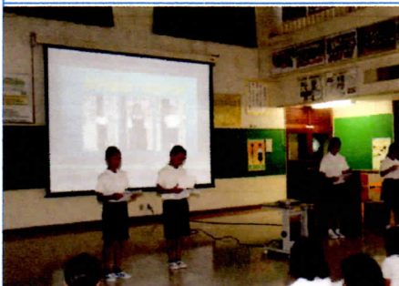
写真4 児童会役員による発表