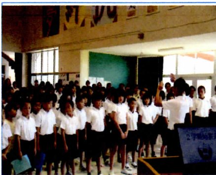
写真1 始業式の様子