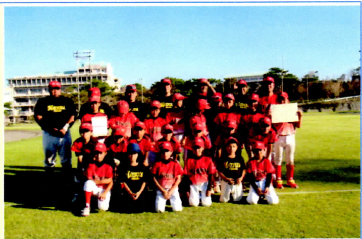
写真3 松田区子ども会 親子野球参加者