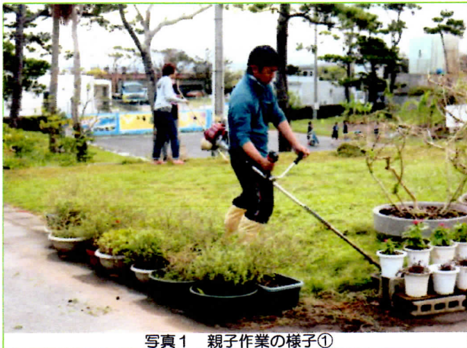
写真1 親子作業の様子①

広い広い校庭が、多くの方々のご協力により、安全できれいな環境に保たれているのだと、実感しています。こちゃまつり(学習発表会)をきれいな環境でむかえられることに感謝の気持ちでいっぱいです。