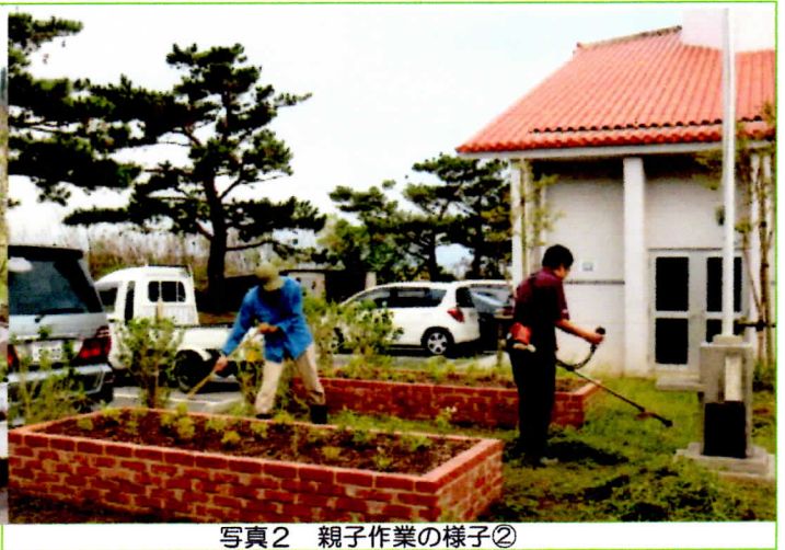
写真2 親子作業の様子②