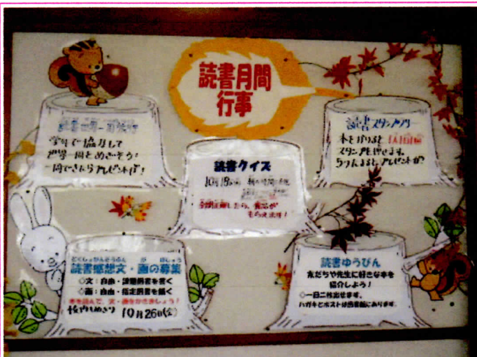
写真4 読書月間の掲示物