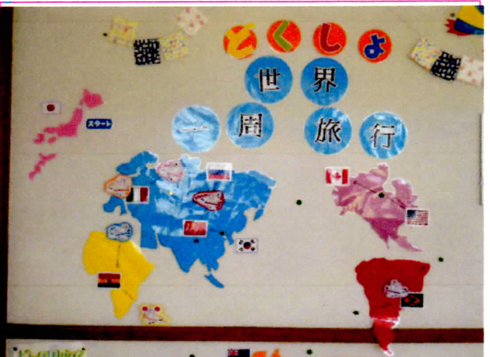
写真5 読書世界一周旅行の地図